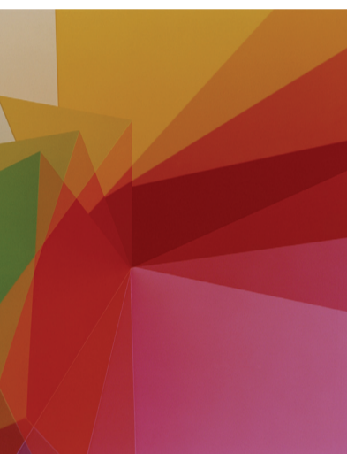
Obr. 1 Shirana Shahbazi, Klausenpass 01, C-print, 2011, Courtesy Bob van Orsouw, Zurich and Cardí Black Box, Milan, © Shirana Shahbazi Obr. 2 Shirana Shahbazi, Kompozice 26, 210 x 168 cm, C-print, 2011 © Shirana Shahbazi

Dálka, prostor, nekonečno, vrstvy, průniky. Pozorně si prohlédněte dvojici fotografií hned v prvním výstavním sále: černobílou fotografii horského průsmyku a vedle ní abstraktní barevnou fotografii.